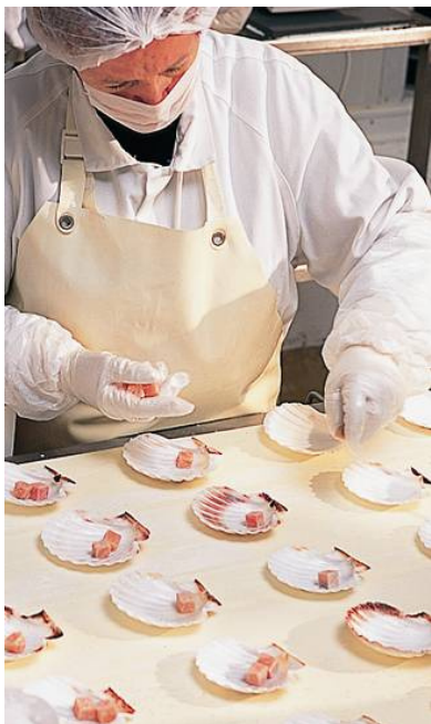
従業員の衛生管理